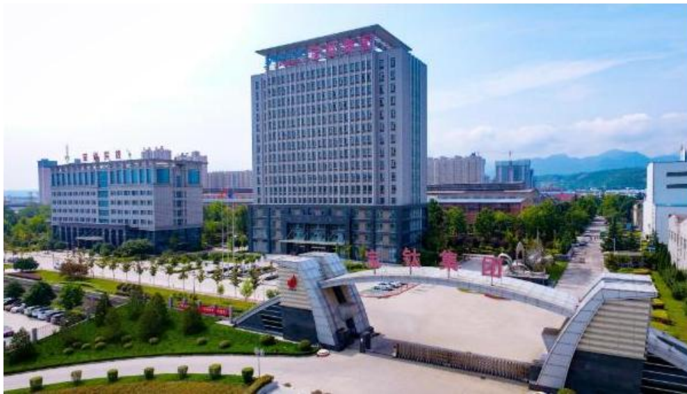
宝钛集团有限公司

宝钛集团有限公司(简称宝钛集团),是宝鸡有色金属加工厂(原902厂)是陕西有色金属产业的大型企业集团,是中国最大的以钛及钛合金为主的专业化稀有金属生产、科研基地,是陕西省首家双高认证的高新技术企业。