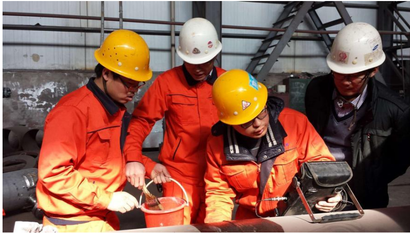
西安展实检测工程有限公司超声波检测现场