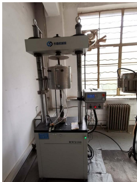
西安汉唐分析检测有限公司压缩蠕变试验机

授权的“陕西省有色金属分析检测与评价中心”、“稀有金属检测信息化管理及共享平台”、“陕西省稀有金属材料安全评估与失效分析平台”。