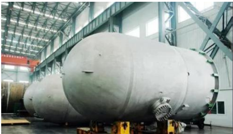
西安核设备有限公司剪影

西安核设备有限公司是中国核工业集团有限公司所属的大型设备设计、制造、集成供货及全寿期运维服务企业。是国内拥有涉核装备制造资质最全的单一法人企业，是中国化工装备协会常务理事单位、陕西省特种装备协会常务理事单位，是陕西省特种设备焊接培训考核基地和西北地区唯一的国家民用核安全设备焊接人员资格考核单位。