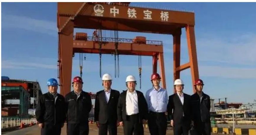
中铁宝桥项目现场

中铁宝桥集团有限公司是国内专业生产钢桥梁、钢结构、铁路道岔、高锰钢辙叉、城市轨道交通设备、门式起重机等产品的大型国有企业，是“中国 100 家最大交通运输设备制造业企业”之一，跻身于“中国机械行业 500 强”之列。公司被铁道部确立为“铁道器材研究发展基地”，陕西省科委认定为“高新技术企业”。