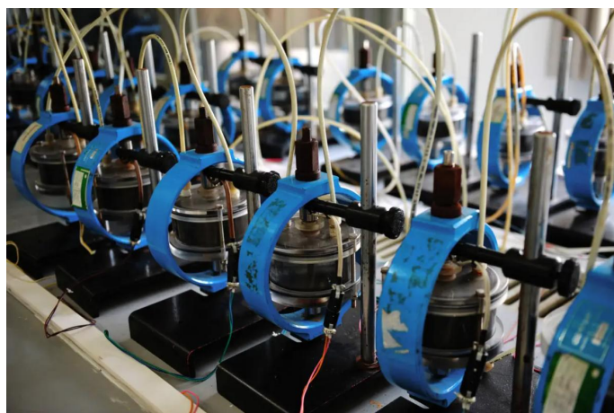
西安摩尔石油工程实验室股份有限公司实验室剪影

西安摩尔石油工程实验室股份有限公司是提供材料与产品应用研究、试验分析、检验检测及技术服务的专业机构。现为美国腐蚀工程师协会（NACE）西安分会联络处，中国机械工程学会失效分析分会网点单位，中国设备监理协会常务理事单位，中国工业防腐蚀技术协会理事单位，陕西省机械工程学会理事单位，陕西省设备监理协会理事单位，中国石油工程建设协会防腐保温技术专业委员会会员单位。