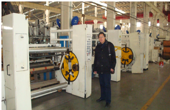
专业教师在北人印机车间