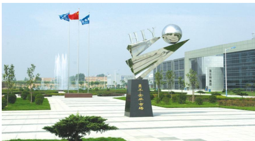
陕西法士特集团公司

中国机械工业 100 强、中国制造业企业 500 强、中国大型工业企业 1000 强行列。