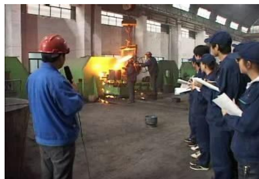
陕西柴油机重工车间实训