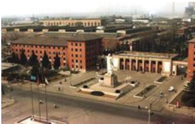
中国一拖集团公司

企业。一拖集团公司从 1959 年建厂至今，累计生产大中小拖拉机 120 万台，大中拖占全国市场的 45%，小拖占全国市场的 15%，此外，一拖集团公司还向军队提供了大量装备。凭借 150 万台拖拉机的生产经验以及由此奠定出独具特色的工艺水平和技术实力，中国一拖集团有限公司成为卓越的农业机械制造专家，在这一领域享有极高的声誉。是我国农机行业中唯一的特大型企业。“东方红”商标为中国驰名商标。中国一拖集团公司（洛阳）拥有六条机械化、自动化的合金生产流水线，具有技术多样、工艺全面，检测手段先进的特点，是材料成型技术集中应用的超大型企业，是生产实习、专业综合实习的理想场所。