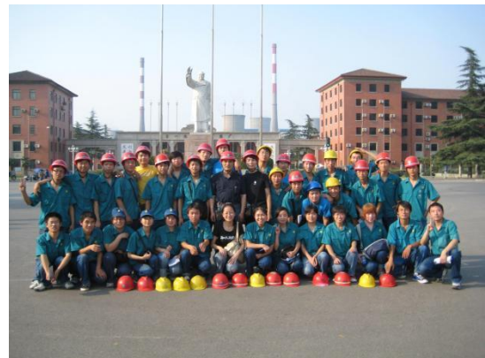
学生赴中国一拖集团生产实习