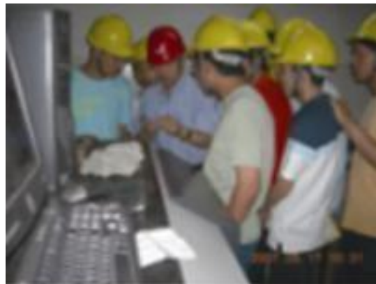
学生在光谱分析检验室实习