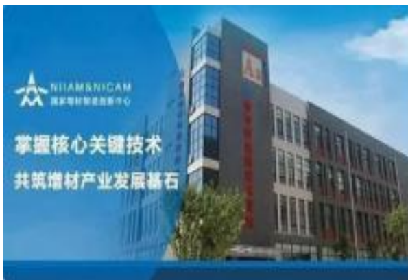
西安增材制造国家研究院有限公司主建筑

由西安交通大学、北京航空航天大学、西北工业大学、清华大学和华中科技大学5所大学及增材制造装备、材料、软件生产及研发的13家企业共同组建，地点位于西安高新区。作为国家增材制造创新的依托公司和承载主体，它将汇聚国内外人才及相关国家实验室、工程和工程实验室等科研资源，为国内制造业的转型和创新发展提供重要支撑，服务中国制造2025。增材制造国家研究院将成为中国、乃全球资本市场青睐的以增材制造集成技术供应源为重要特征的高市值上市公司。增材制造国家研究院以国家战略性目标和制造业创新发展为导向，制定发展战略和科研计划，瞄准重大设备、重要材料、关键工艺、核心软件、核心元器件等共性关键技术，进行自主研发与技术集成，突破行业技术瓶颈，打造完整的创新链。是学生进行3D打印技术、精密成型技术、专业综合实习、定岗实习的理想场所。