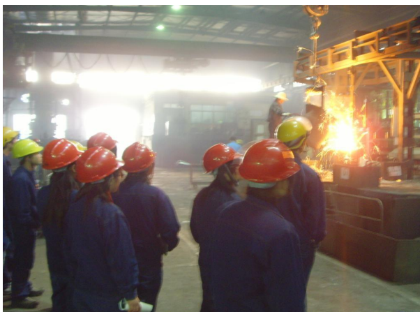
秦川机床工具集团有限公司