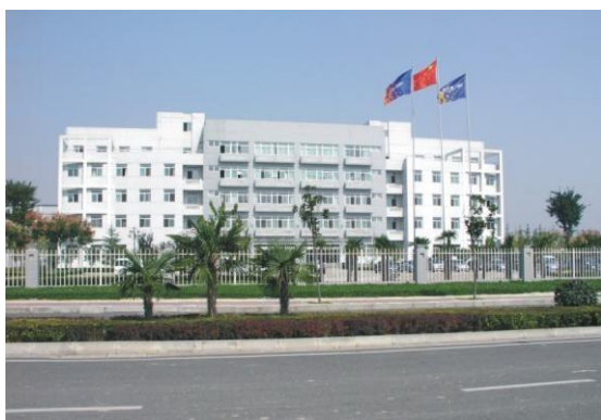
陕西北人印刷机械有限责任公司