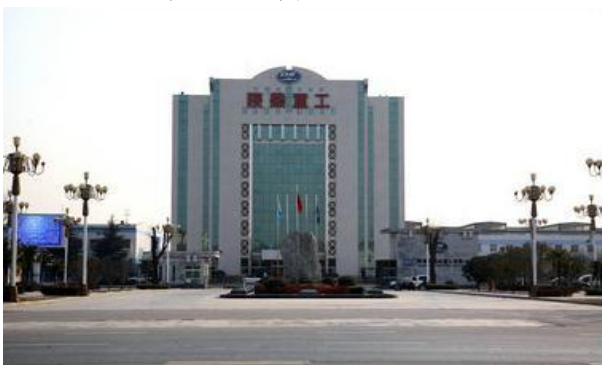
陕西柴油机重工有限公司

陕西柴油机重工有限公司，是中国船舶重工集团公司所属的国内规模最大的船用中、高速大功率柴油机和柴油发电机组成套制造商和供应商。产品广泛应用于中、小型民用船舶主机，大型散货船和大型集装箱船辅机，以及核电站应急发电机组、陆用电站、海洋工程、风电等领域，并远销中美洲、南美洲和亚洲的多个国家。