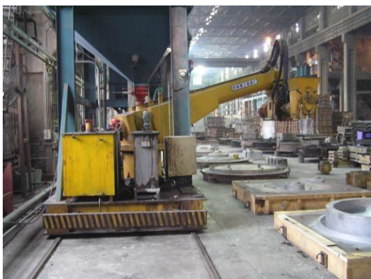
西安维美德造纸机械有限公司生产车间