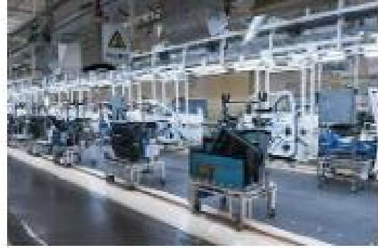
熔模铸造自动化生产线