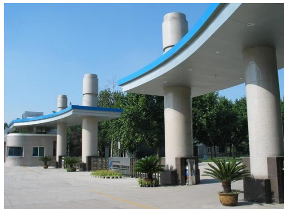
西安北方华山机电有限公司